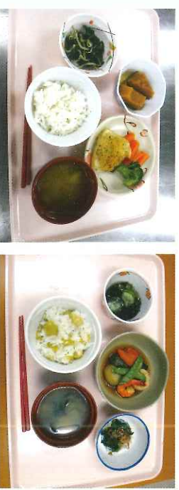
素材と調理法を活かし、美味しい食事を提供致します。